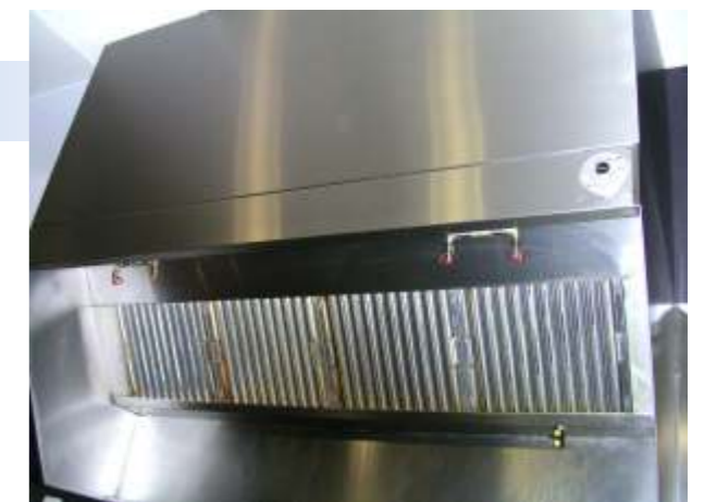
Grillhaube mit integriertem Feuerlöschsystem